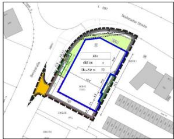
Stand erneute Offenlage

2) In dem textlichen Teil des Bebauungsplans und der örtlichen Bauvorschriften sind die Ergänzungen durch eine doppelte Unterstreichung (rot) dargestellt, die entfallenen Textteile sind durchgestrichen (dunkelblau).